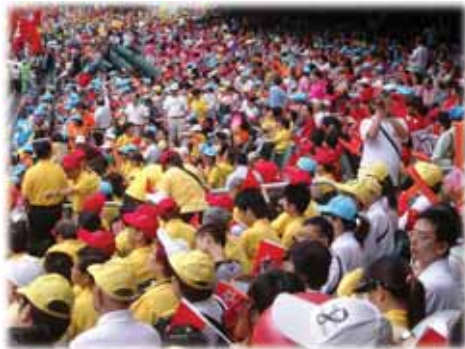
▲ 參加慶祝回歸活動的市民 九七回歸喚起了更多香港人的國族之思。

洛淵源錄》：「宋朱光庭詣汝州，就學於程明道（顯），歸，語人曰：『某在春風中坐了一月。』」桃