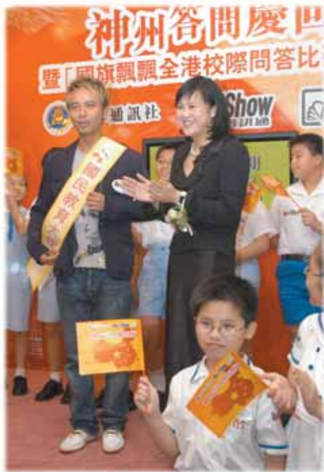
▲ 香港的國民教育活動 政府和有關團體積極推行國民教育，有助凝聚香港人的家國之情。

失去！ 山，但我們數千年傳下來的「人情」傳統，是我中華民族的精神命脈，絕不能讓它