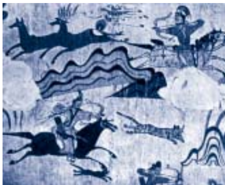
🔵 描繪狩獵情景的高句麗墓穴壁畫 (公元 6 世紀)

三國時代 ( Samguk / Three Kingdoms ) 古代朝鮮三國鼎立的時期：(1) 新羅 (2) 百濟 (3) 高句麗。 說明 公元前 57 年，新羅興起於辰韓地區；公元前 18 年，百濟興起於馬韓地區；公元 3 世紀左右，新羅和百濟分別統一這兩個地區，建立起兩個國家。公元前 37 年，高句麗興起於中國東北的東南部；公元 313 年和 314 年，先後滅樂浪郡和帶方郡。自此三國在朝鮮半島互爭雄長，直至 7 世紀中葉，新羅滅百濟和高句麗，形成了統一新羅時代。