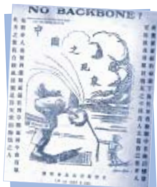
1915年的一幅美國漫畫，顯示中國在《二十一條》下被日本(圖中小人)控制的情況。