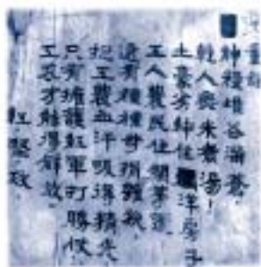
⊙ 紅軍在長征途中編寫的童謠，反映當時工人和農民受盡土豪劣紳的壓迫。

二萬五千里長征 簡稱「長征」。中國共產黨根據地於 1934 至 1935 年由江西轉移至陝北的長征。 說明 北伐完成後，國民政府在蔣介石領導下，對共產黨根據地進行五次「圍剿」。共產黨被國民政府軍圍困在江西的根據地，形勢危急，後決定突圍，前往陝北根據地。當時共產黨有不少根據地分佈在長江南北，除陝北根據地外，其他紅軍都先後退出原來的根據地，加入長征。1934 年 10 月至 1935 年 10 月整整一年間，紅軍經過福建、江西、廣東、湖南、廣西、貴州、四川、雲南、西康、甘肅、陝西等 11 個省，行程 2 萬 5 千里，終於到達陝北根據地會合。紅軍在第五次「圍剿」前本來已發展至 30 萬人，長征途中受到重大折損，到達陝北根據地延安時，只餘下不足 3 萬人。