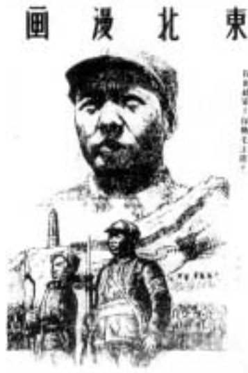
《東北漫畫》的封面(1946年)