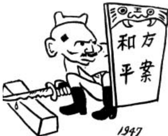
此漫畫名為「刀子準備好就再開殺戒」(1947年)

此節錄文字描述一位農民對土地改革持正面態度。她形容土地改革前工作得如奴僕般，更常遭打罵；但改革之後，她可為自己工作，並擁有房子及必須品。