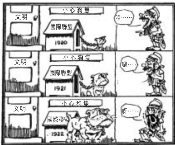
對國際聯盟的樂觀看法（1920年6月）