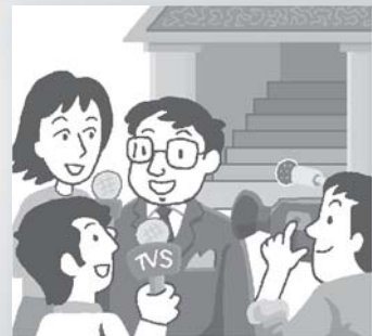
▲新聞從業員應作出客觀的採訪