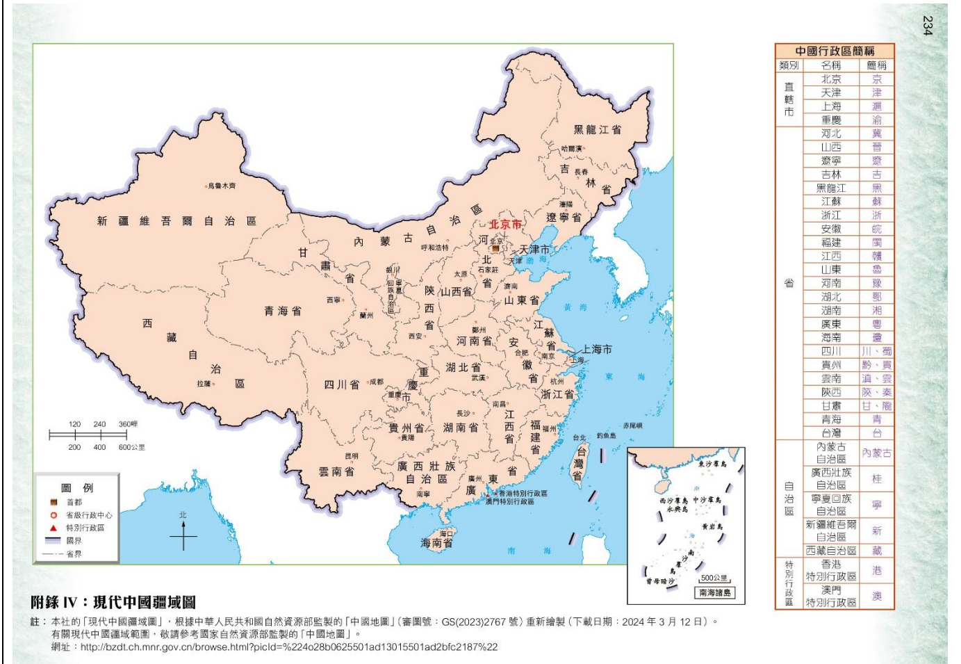
附錄 IV：現代中國疆域圖