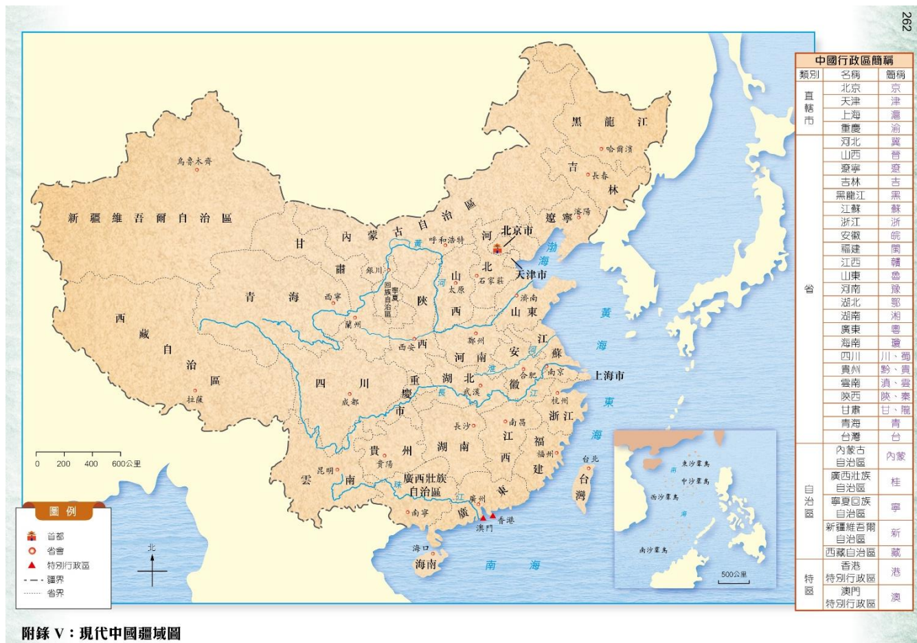
附錄 V：現代中國疆域圖