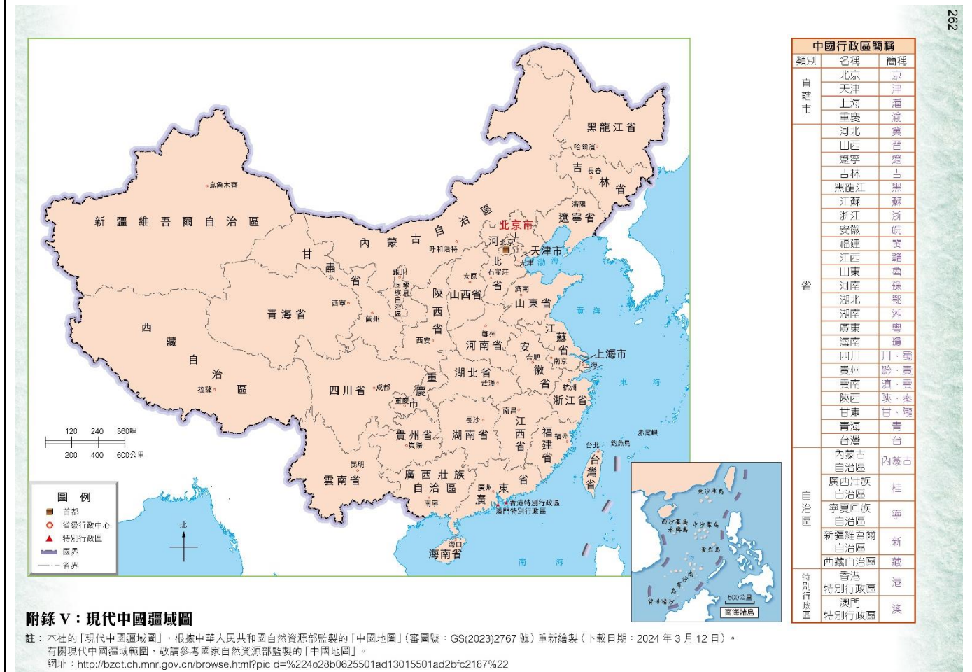
附錄 V：現代中國疆域圖

註：本社の「現代中國疆域圖」，根據中華人民共和國自然資源部製作的「中國地圖」（審圖號：GS(2023)2767 號）重新繪製（下載日期：2024 年 3 月 12 日）。有關現代中國疆域範圍，敬請參考國家自然資源部製作的「中國地圖」。 網址： http://bzdt.ch.mnr.gov.cn/browse.html?picId=%224028b0625501ad13015501ad2bfc2187%22